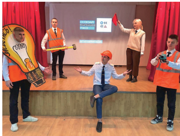
Рис. 4. Выступление агитбригады

и привлечение абитуриентов, сделавших сознательный выбор в пользу получения железнодорожной профессии. Идейным вдохновителем агитбригады «Создай будущее РЖД» является студенческий совет. В работе агитбригады принимают участие студенты, преподаватели, сотрудники филиала.