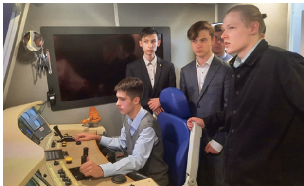
Рис. 2. Мастер-класс на тренажере 2ЭС6 Синара

Агитбригада основана в 2018 г. с целью создания положительного имиджа Рязанского филиала ПГУПС и популяризации железнодорожных профессий среди широкого круга общественности. Главная задача агитбригады — выстраивание устойчивой коммуникации с общественностью