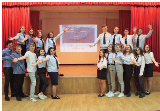
Рис. 3. Выступление агитбригады