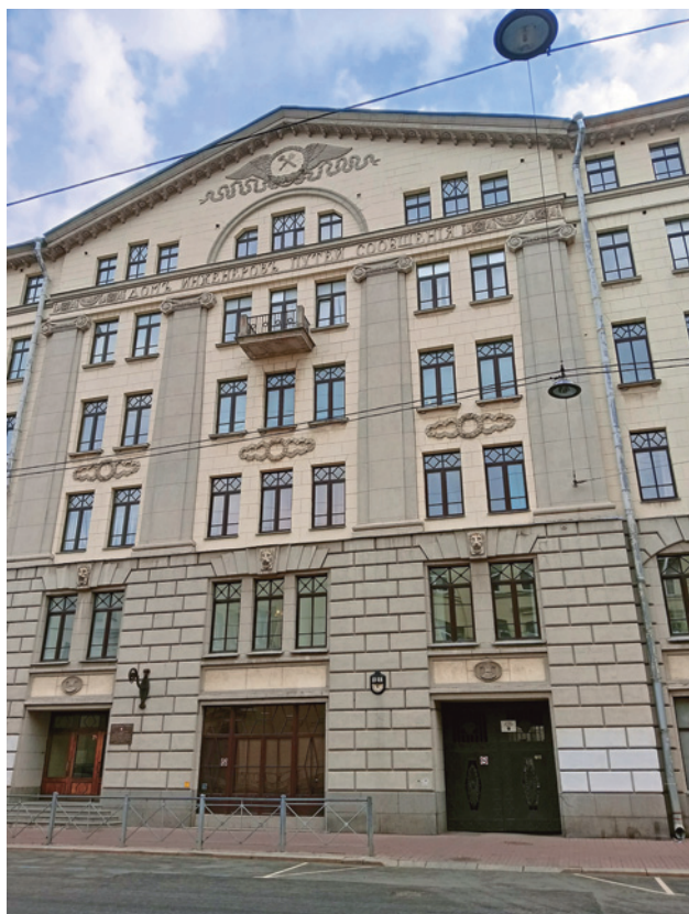
Рис. 1. Историческое здание техникума на Бородинской улице

техникума, специальностей и организации обучения. В стране преобладали жесткие, командные формы и методы управления, которые сочетались с военным порядком. Техникум имел всесоюзное значение, поэтому выпускники распределялись на работу по всей сети железных дорог СССР. В годы войны техникум был эвакуирован на станцию Тайга Томской железной дороги, куда уехали треть студентов и 8 преподавателей из 41. Тайгинский техникум сегодня устойчиво лидирует среди учебных заведений среднего звена, в чем просматривается, на наш взгляд, ленинградский след в его истории.