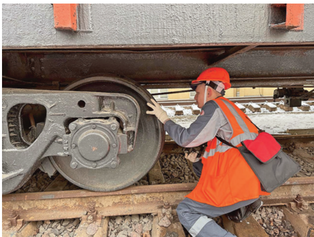
Рис. 6. Демонстрационный экзамен проводится в реальных производственных условиях

других стран. Так, в сборнике материалов Международной научно-практической конференции, которая прошла в техникуме 18 декабря 2018 г., опубликованы статьи из Технического колледжа железнодорожного транспорта г. Бельцы (Молдова), Высшего колледжа транспорта и коммуникаций г. Нур-Султан (Казахстан). В юбилейных торжествах 2018 г. принимали участие руководители Самаркандского колледжа железнодорожного транспорта (Узбекистан). В конференции 2021 г. в список участников вошли преподаватели Ташкентского железнодорожного техникума. Кроме того, применение дистанционных форматов позволило существенно расширить географию международных контактов: приняли участие в конференции представители Чжэнчжоуского железнодорожного профессионально-технического института (Китай).