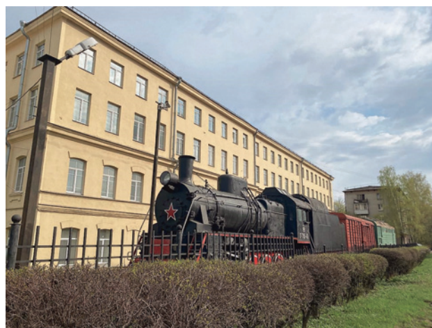
Рис. 2. Учебный корпус на ул. Седова (бывший Электромеханический техникум)

Сегодня в техникуме обучается около 1800 студентов очной и заочной форм обучения по специальностям: 08.02.10 «Строительство железных дорог, путь и путевое хозяйство»; 09.02.04 «Информационные системы (по отраслям)»; 11.02.06 «Техническая эксплуатация транспортного радиоэлектронного оборудования (по видам транспорта)»; 13.02.07 «Электроснабжение (по отраслям)»; 23.02.01 «Организация перевозок и управление на транспорте (по видам)»; 23.02.06 «Техническая эксплуатация подвижного состава железных дорог (электроподвижной состав)»; 23.02.06 «Техническая эксплуатация подвижного состава железных