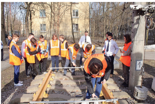
Рис. 5. Профориентационная работа на учебном полигоне

С целью привлечения нового контингента техникум активно участвует в профориентационной работе города. На базе СПбТЖТ проходят профессиональные пробы в рамках проекта по ранней профессиональной ориентации учащихся 6–11 классов общеобразовательных организаций «Билет в будущее» по профессиям: оператор дефектоскопной тележки, дежурный по железнодорожной станции, проводник пассажирского вагона, слесарь по обслуживанию и ремонту вагонов, электромонтер тяговой подстанции, электромонтер по ремонту и обслуживанию аппаратуры и устройств связи, контролер состояния железнодорожного пути (рис. 5).