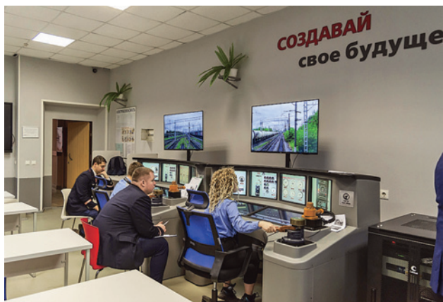
Рис. 4. Тренажер виртуальной реальности машиниста локомотива

В класса». Осуществлялась профессиональная подготовка с учетом стандарта Ворлдскиллс по компетенции «Управление перевозочным процессом на железнодорожном транспорте» и по профессии «Контролер состояния железнодорожного пути», профессиональная подготовка с учетом стандарта Ворлдскиллс по компетенции «Контроль состояния железнодорожного пути».