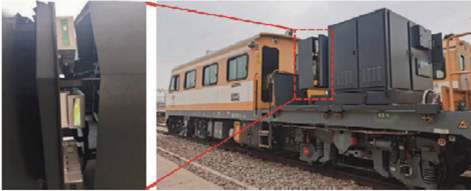
Рис. 2. Система исследования путевых устройств на рельсовом ходу

Китайскими учеными для классификации и сегментации трещин в тоннелях с повышенной точностью и эффективностью предлагается [9] двухэтапный метод на основе глубокого МО. На первом этапе разработана модель автоматической классификации изображений тоннелей с использованием нейронной сети DenseNet-169. Предложенная модель сегментации трещин на втором этапе основана на алгоритме DeepLabV3+ [10] устранения фона и повышения качества выделения собственно трещин. Предлагаемый метод объединяет классификацию и сегментацию тоннельных изображений, поэтому отобранные на первом этапе изображения, содержащие трещины, сегментируются на втором этапе для повышения точности и эффективности обнаружения. Повышенные характеристики двухэтапного метода подтверждены экспериментами.